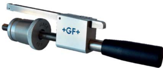
RSE – Dimensionsgebunden