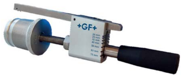
RSE Multi – Dimensionsübergreifend